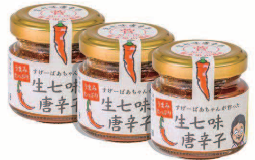
すげーばあちゃんのおくりもの 生七味唐辛子 ¥2,322

菅地域の「自然の恵み」とすげーばあちゃん「愛情」がこもったこだわりの商品がネットで買えるのはコチラ！