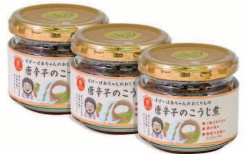
すげーばあちゃんのおくりもの 唐辛子のこうじ煮 ¥2,646