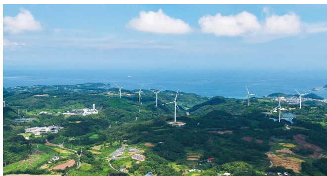
九電みらいエナジー 唐津・鎮西ウィンドファーム

当社は、“みらいを拓く、世界有数のグリーンエネルギー企業”となることを目指しています。主要な再エネ5電源（太陽光・風力・バイオマス・地熱・水力）を保有する国内唯一の再エネ事業者であることの強みを活かし、多様化するお客さまや社会のエネルギーニーズに積極的に対応しながら、再エネの普及・拡大に貢献してまいります。