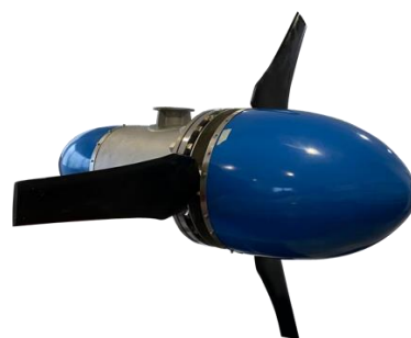
図 2. 発電機写真