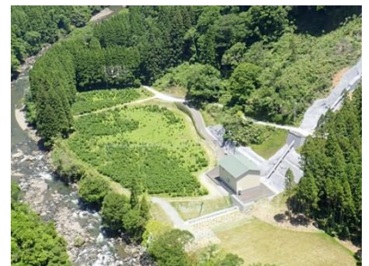
かもしし 鴨猪水力発電所 (熊本県)

[お問い合わせ先] 九電みらいエナジー株式会社 営業本部 TEL:0120-0910-17