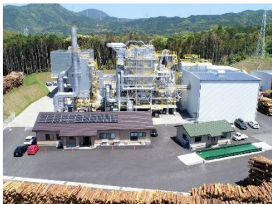
ふくおか木質バイオマス発電所 (福岡県)

当社は、主要再エネ5電源（太陽光、風力、バイオマス、地熱、水力）全ての開発・運営を一貫して手掛ける数少ないエネルギー事業者です。地域の貴重な再エネ資源を大切に使用させていただきながら、皆さまとともに開発を進めています。