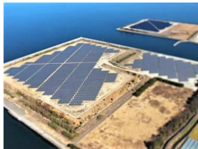
大村メガソーラー第1～4発電所 (長崎県)